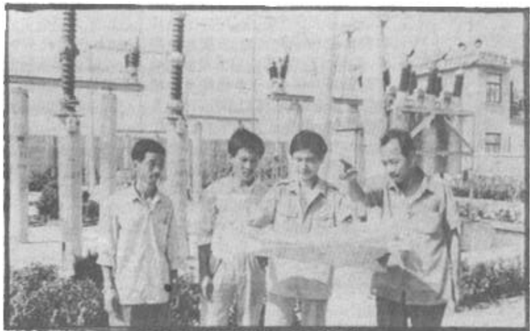
广饶县西营乡农电站认真抓好安全工作，创造了供电20年无责任事故的好成绩，受到有关部门的表彰。图为农电站领导在制定安全用电规划。